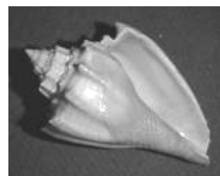
Athleta spinosus - 41 mm