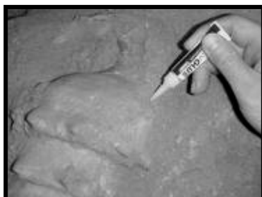
Astuce n°1: colle forte

Nous espérons que ça puisse vous aider dans la pratique, nous vous souhaitons de belles découvertes.