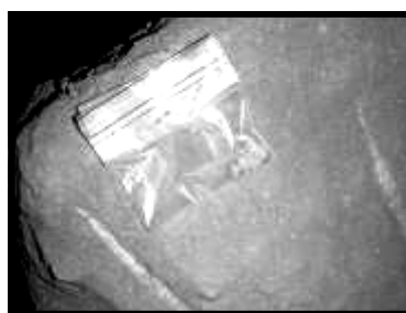
Astuce n°2: petit sachet