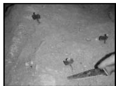
Astuce n°3: fanions