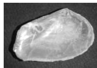
Bathytormus lamellosus - 34 mm